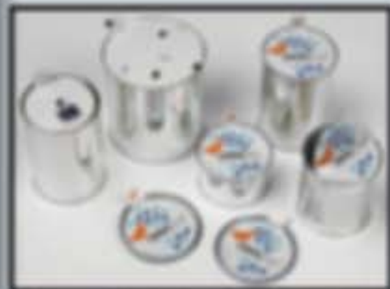
Lättavtagligt lock lös enkelt med händerna eller konsumenterna.