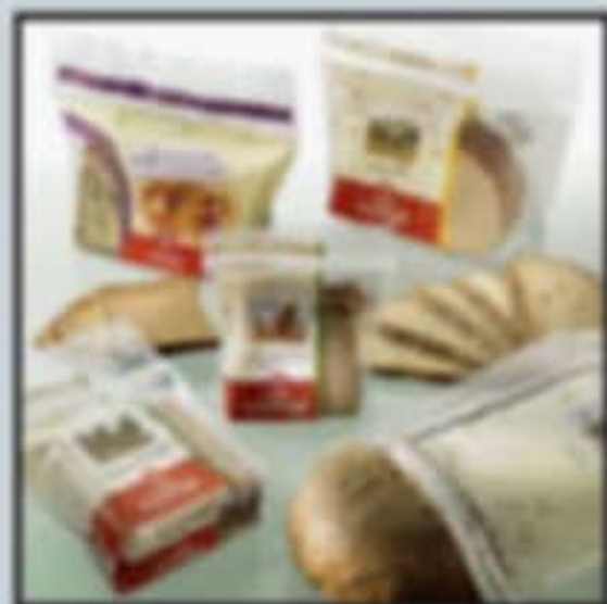
Färdiga brödsäckar från Schur.

monterad på fyllningsmaskinen. Ur hygienisk synpunkt finns inga delar under maskinen vilket gör det lätt att göra rent.